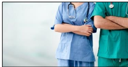
Stichting Medische Opleidingen

Locatie Westplein 12 te Rotterdam Dag en tijd dinsdag van 18.15 tot 22.00 uur (incl. diner) Totaalprijs 425 euro Contact info@medischeopleidingen.nl / 06-13 09 78 44